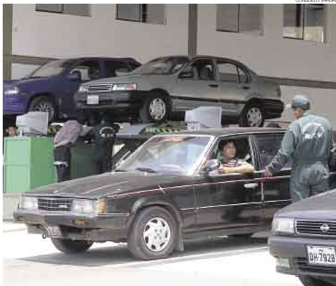
HUBO POCOS. Con la suspensión de las acciones de fiscalización de los vehículos que no pasaron las revisiones técnicas, el número de vehículos (placa 9) que debían pasar revisión ayer disminuyó notablemente.

¿Por qué solo el 30%? La consultora ha preferido no declarar en tanto se trata de información privada de uno de sus clientes, pero el teniente alcalde de Lima reconoció ayer que “se dieron cifras que no se ajustan a la reali-