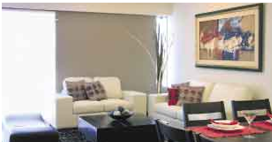
Luz. Se ha considerado la iluminación natural y artificial como un elemento básico de la decoración.