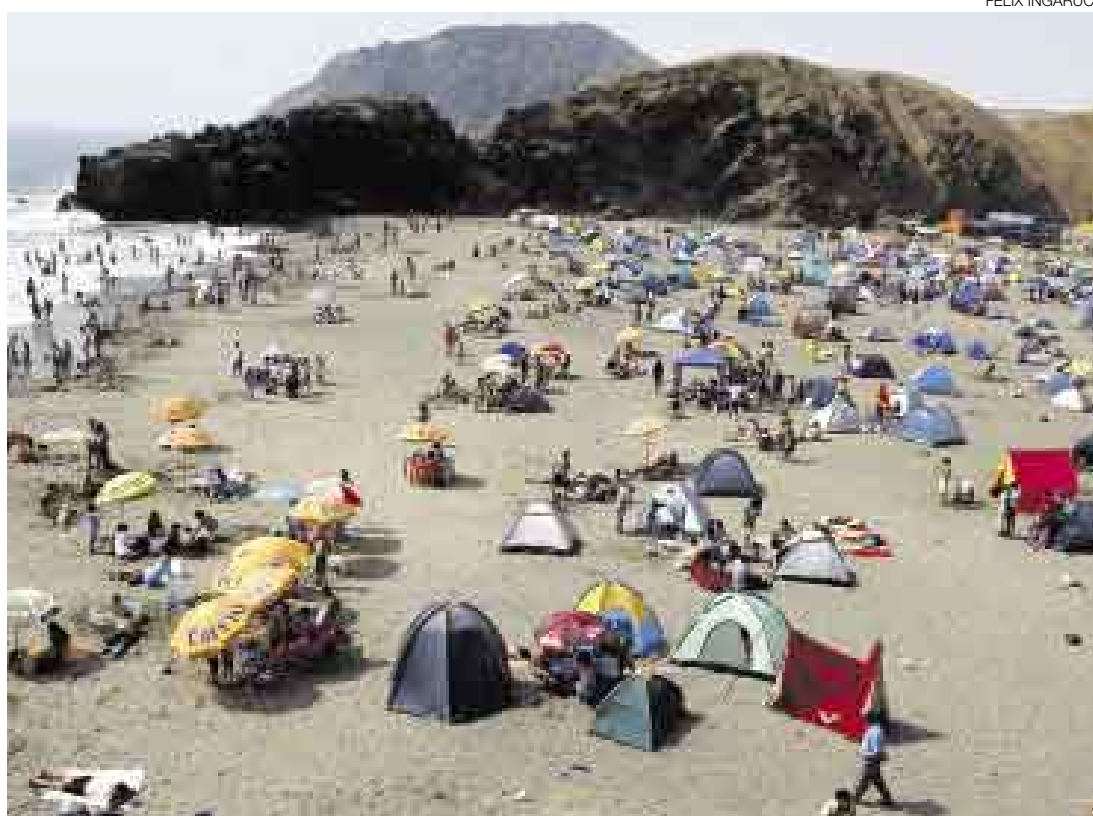
CAMPAMENTOS. Como se observó en León Dormido, una multitud recibió el nuevo año en las playas, que contaron con vigilancia policial. Al final quedó un reguero de basura en la arena: desde serpentinatas hasta botellas.

Estas operaciones no lograron evitar que se produjeran accidentes en las pistas. Desde las cero horas hasta las 11 a.m. de ayer, los bomberos recibieron reportes de 17 accidentes de tránsito. Aunque según los registros de su central telefónica ninguno de ellos dejó víctimas fatales, la Policía de Carreteras reveló que a las 4:30 a.m. un hombre de unos 25 años murió a causa de un atropello en el kilómetro 42 de la Panamericana Sur, a la altura de San Bartolo (dirección sur-norte). El responsable sur.