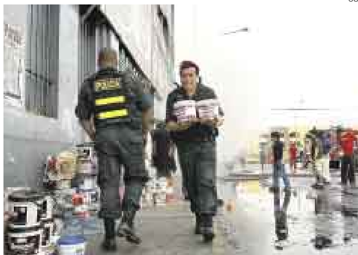
ALARMA. Seis puestos de pintura ardieron cerca de Las Malvinas por motivos desconocidos. Otros 11 incendios fueron causados por pirotécnicos.