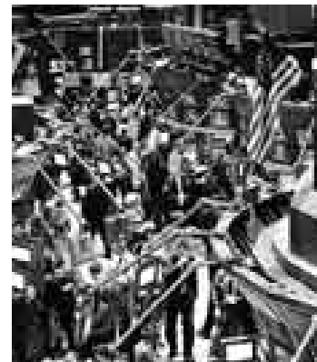
APÁTICA. La bolsa de Lima no registró movimientos importantes.