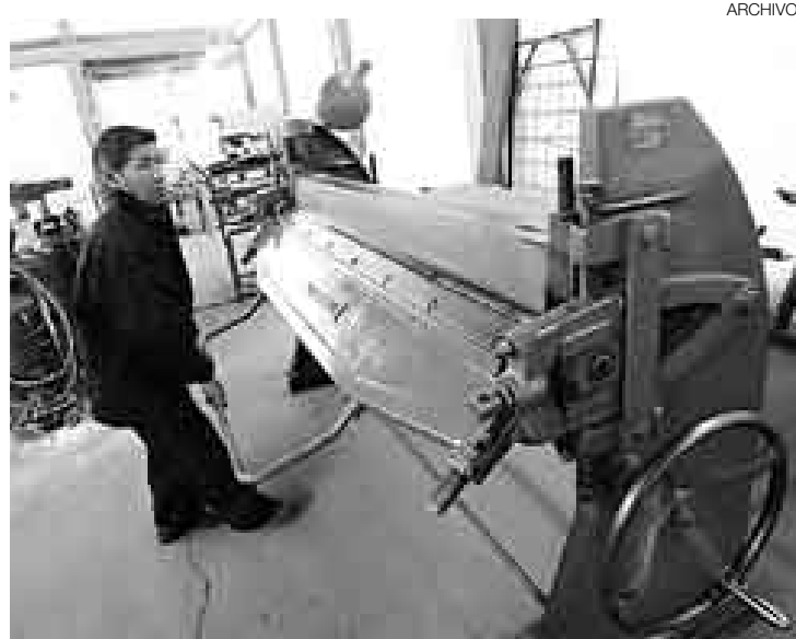
SOBRECOSTO. Su implementación sí generará un desembolso adicional, pues se deberá contratar a una persona para procesar toda la nueva data.

"El costo del libro de planilla para una mype no es significativo, porque si tienes tres o cuatro trabajadores este puede renovarse cada cuatro meses. Sin embargo, ahora se deberá gastar en la contratación de nuevo personal para consignar todos los datos que exi-