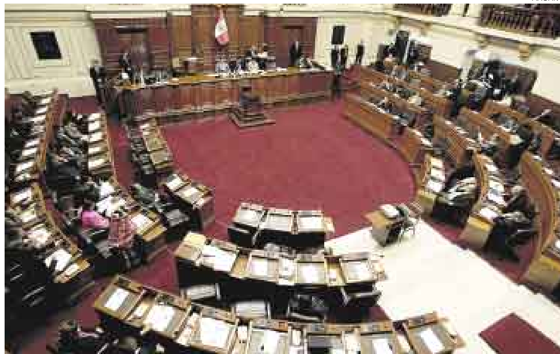
VEREMOS. La revisión de las funciones del TC pasa por una reforma constitucional aprobada en mayoría por el Congreso.