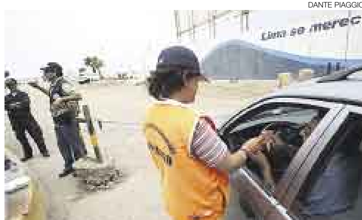
PAGUE AHORA. En la playa Barranquito el cobro es de S/.5 y por adelantado, así sea solo por unos minutos, como lo aclaró la señorita de la foto.