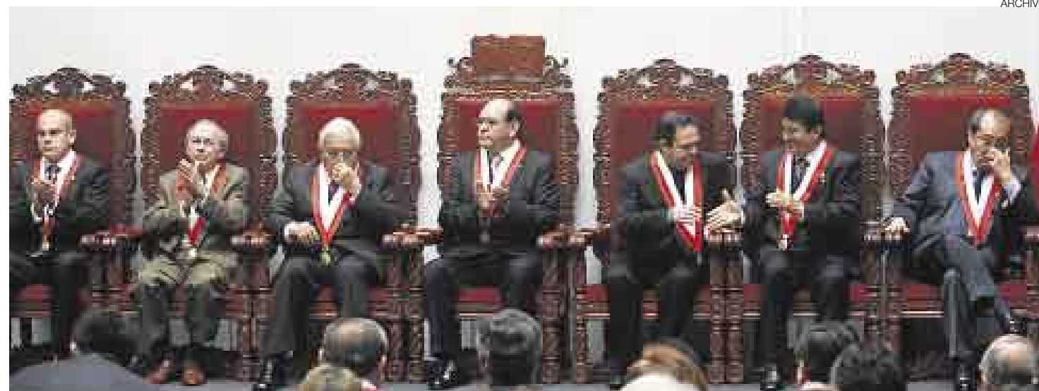
VAPULEADOS. Al interior del TC hay preocupación porque su imagen se ha visto desacreditada.

■ Sentencia sobre otro pedido de referéndum podría incluso salir hoy