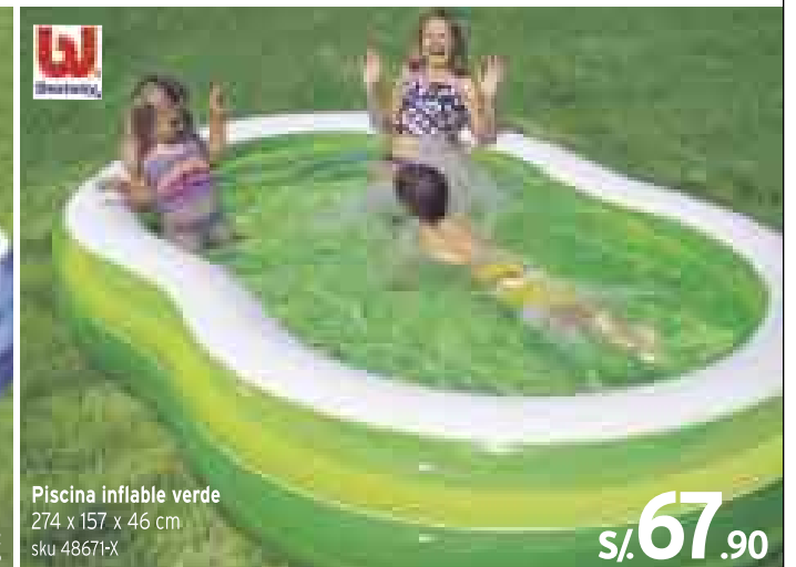
Piscina inflable verde 274 x 157 x 46 cm sku 48671-X S/. 67.90