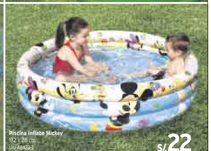
Piscina Inflable Mickey 132 x 28 cm sku 48423-7 S/. 22