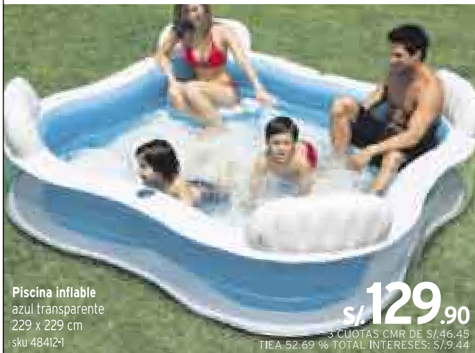
Piscina inflable azul transparente 229 x 229 cm sku 48412-1 S/. 129.90 3 CUOTAS CMR DE S/.46.45 TIEA: 52.69% / TOTAL INTERESES: S/.9.44

POR LA COMPRA DE CUALQUIER INFLABLE + S/.5 LLEVATE UN INFLADOR DE 30 CM sku 43962-2