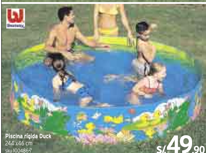
Piscina rígida Duck 244 x 46 cm sku 100486-7 S/. 49.90