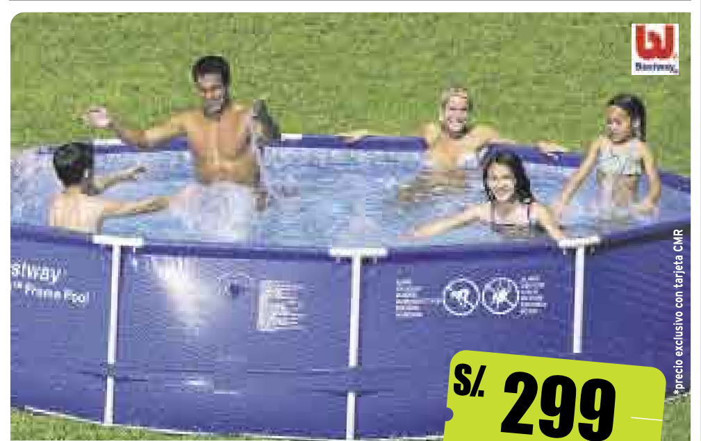
Piscina estructural redonda 305 x 76 cm / 4,678 L sku 47613-7 S/. 299 precio normal S/.399 3 CUOTAS DE S/.106.91 TIEA 52.69% / TOTAL INTERESES S/.21.72