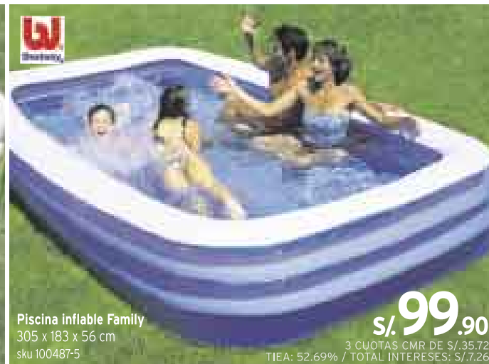
Piscina inflable Family 305 x 183 x 56 cm sku 100487-5 S/. 99.90 3 CUOTAS CMR DE S/.35.72 TIEA: 52.69% / TOTAL INTERESES: S/.7.26