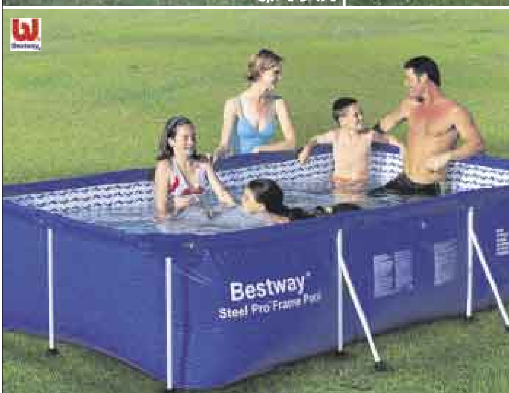
Piscina estructurada rectangular 259 x 180 x 66 cm Capacidad: 2,321 litros sku 100488-3 S/. 299 3 CUOTAS CMR DE S/.106.91 TIEA 52.69% / TOTAL INTERESES: S/.21.72