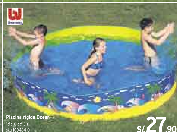
Piscina rígida Ocean 183 x 38 cm sku 100484-0 S/. 27.90