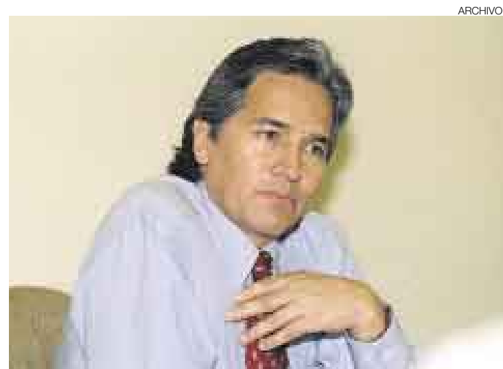
PROYECTOS. Huaroc sostiene que durante este año se trabajará en la consolidación de la oferta exportadora de la región.

El presidente regional de Junín señaló que también se combatirá la corrupción en todos los