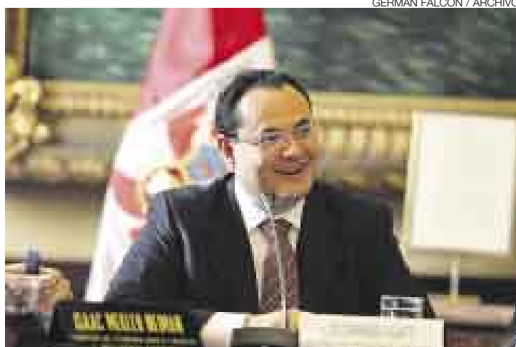
DADIVOSO. Bono se activó porque economía creció más de 7% el 2007.

“Dadas las condiciones excepcionales de la economía es que se ha decidido adelantar la entrega del bono al mes de enero. Entonces, este mes todos los funcionarios, cuando reciban su