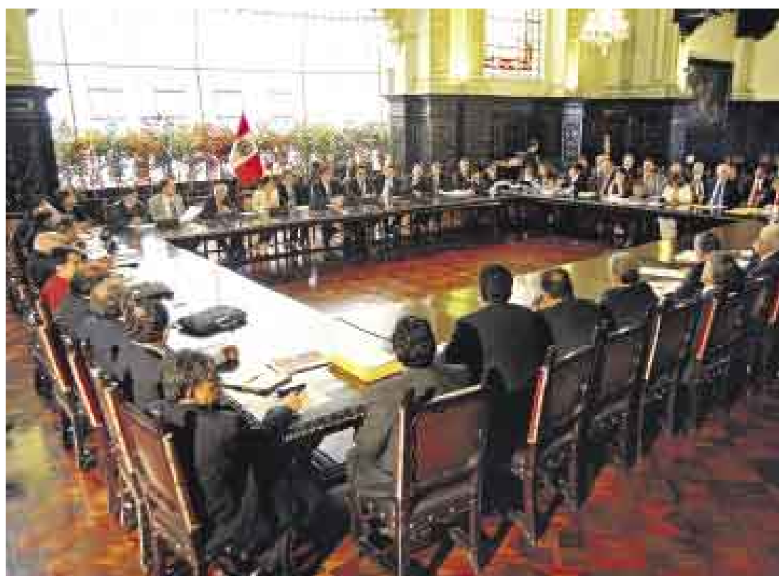
ARDUA SESIÓN. Tras el saludo, los presidentes regionales se dividieron en cuatro grupos de trabajo.

La agenda común contemplará los pasos por seguir para lograr un TLC hacia adentro, el éxito del foro del APEC y cuestiones más