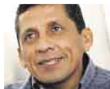
YA NO SALE. Antauro Humala seguirá su proceso en prisión.

■ Poder Judicial amplió su reclusión por 36 meses más. Abogado dice que denunciará a vocales