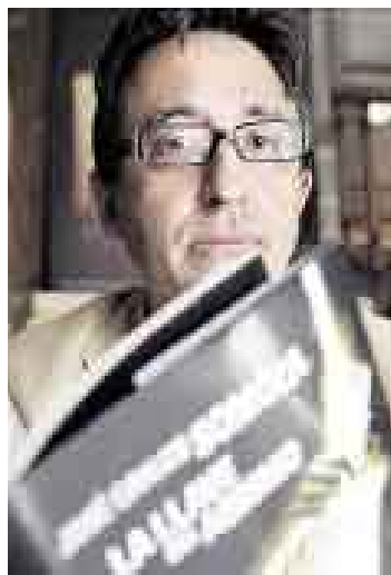
SOMOZA. Un brillante relato de horror y ciencia ficción.

No entendemos por qué se habla menos de José Carlos Somoza que de otros novelistas españoles actuales (digamos, Marías, Cercas, de Prada, Muñoz Molina, Pérez Reverte, qué sé yo), si es autor de una docena de novelas (publicadas en sucesión apabullante, año tras año, desde 1996) de trama perfecta en casi todos los casos. Obras que reelaboran con originalidad y hondura psicológica, además de con riqueza de alusiones culturales que no estorban la fluidez de la acción narrativa (es decir, lo que no consiguen Joyce ni Borges, a quienes Somoza admira), la novela erótica y la música ("Silencio de Blanca", 1986), la cinefília ("La ventana pintada", 1998), el género epistolar ("Cartas de un asesino insignifi-