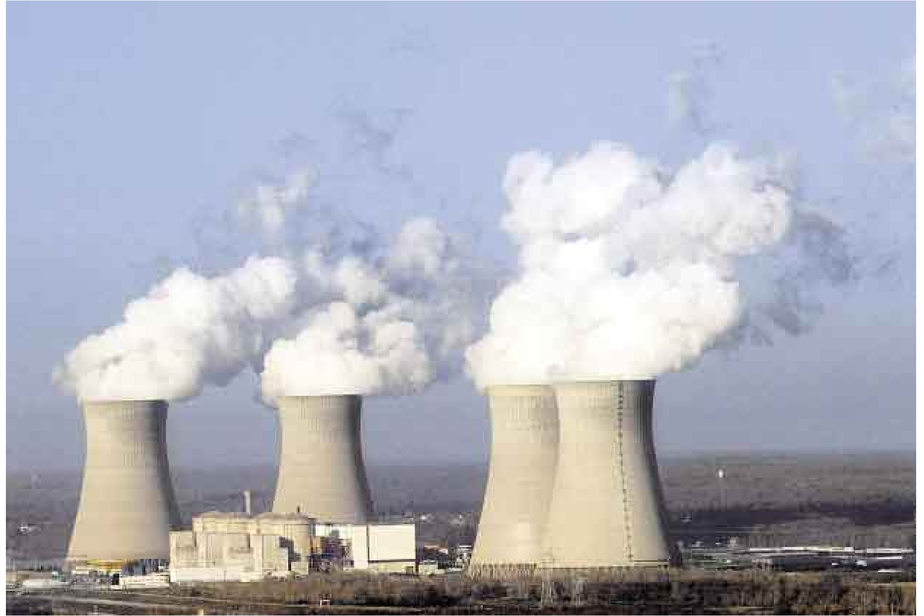
LUCHA CONJUNTA. Los 27 países de la Unión Europea tendrán que ponerse de acuerdo sobre cómo distribuir entre sí la carga que implica combatir el cambio climático.

En marzo pasado los líderes de la UE acordaron el ambicioso objetivo de reducir en un 20% sus emisiones de CO 2 de cara al 2020 con respecto a 1990. Lo que no pactaron fue la magnitud de los esfuerzos que cada país deberá emprender con el fin de alcanzar el objetivo común, por lo que la mayoría de expertos vaticina encendidos regateos en los próximos meses. "Los nuevos estados miembros (del centro y este de Europa) no estarán dispuestos a que se les hipoteque sus oportu-