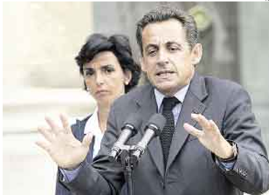
SE PREPARA. El presidente francés Nicolas Sarkozy asumirá la presidencia de la UE a partir del segundo semestre de este año y considera realizar algunos cambios.

Al final de la publicación, en un anexo titulado "Los países en cifras", los analistas de "The Economist" consignan sobre el Perú: "El pronunciado crecimiento global y los elevados precios de las materias primas han permitido al presidente Alan García adoptar políticas modestamente populistas. Pero una posición débil en el Parlamento, el resurgimiento del activismo sindical, escándalos de corrupción y administraciones provinciales rebeldes, debilitarán su autoridad. El alza de los salarios y significativas inversiones sostendrán la economía".