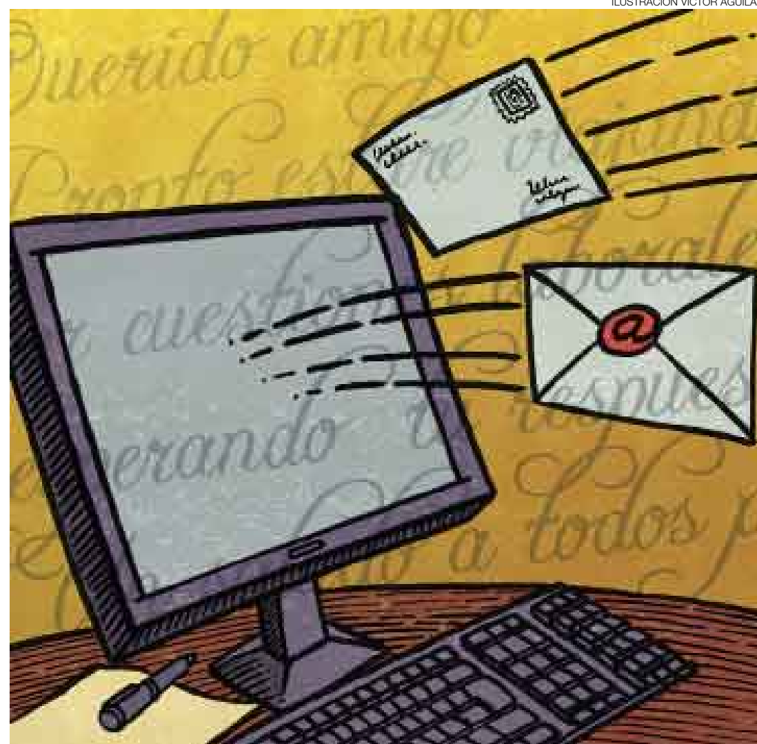
ILUSTRACIÓN VÍCTOR AGUILAR

Ante todo, quede claro que manejo mi correo electrónico tres veces al día y siempre agradeciendo su existencia "a los dioses