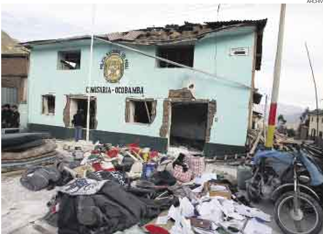
TRÁGICOS SUCESOS. Los atentados terroristas también fueron consignados en el reporte de la Defensoría.

La Unidad de Conflictos Sociales, encargada de la elaboración de este reporte, dio a conocer que, de los conflictos registrados, 26 se encuentran activos y 52