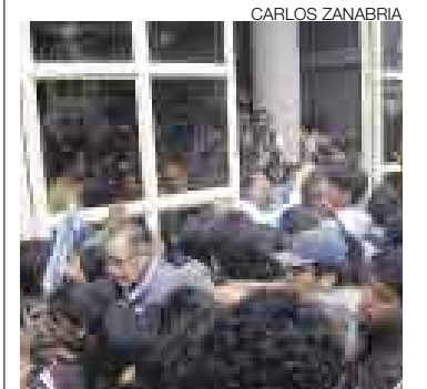
VIOLENCIA. Los catedráticos fueron blanco de insultos.

Unos 200 universitarios insultaron y agredieron a sus catedráticos tras una reunión en la que se evaluó el levantamiento de la huelga que mantienen estos últimos desde octubre del 2007. Los alumnos quisieron presionar para que la paralización sea levantada por lo que, al enterarse de que esto no sucedería, la emprendieron contra los huelguistas.