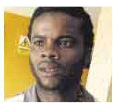
ÍNTIMO. Hasta el momento, Montaña no da la cara a la prensa.