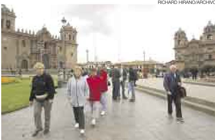
EN VEREMOS. Según se conoció, en el Cusco se tiene previsto realizar doce reuniones del APEC.