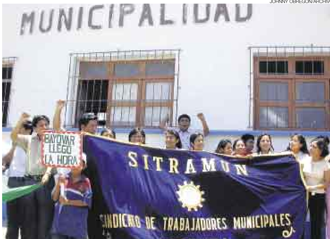
OBSERVACIONES. La población de Sechura puede presentar sus reparos al EIA del proyecto Bayóvar.

Durante la reunión los representantes de entidades y algunos pobladores expusieron sus temo-