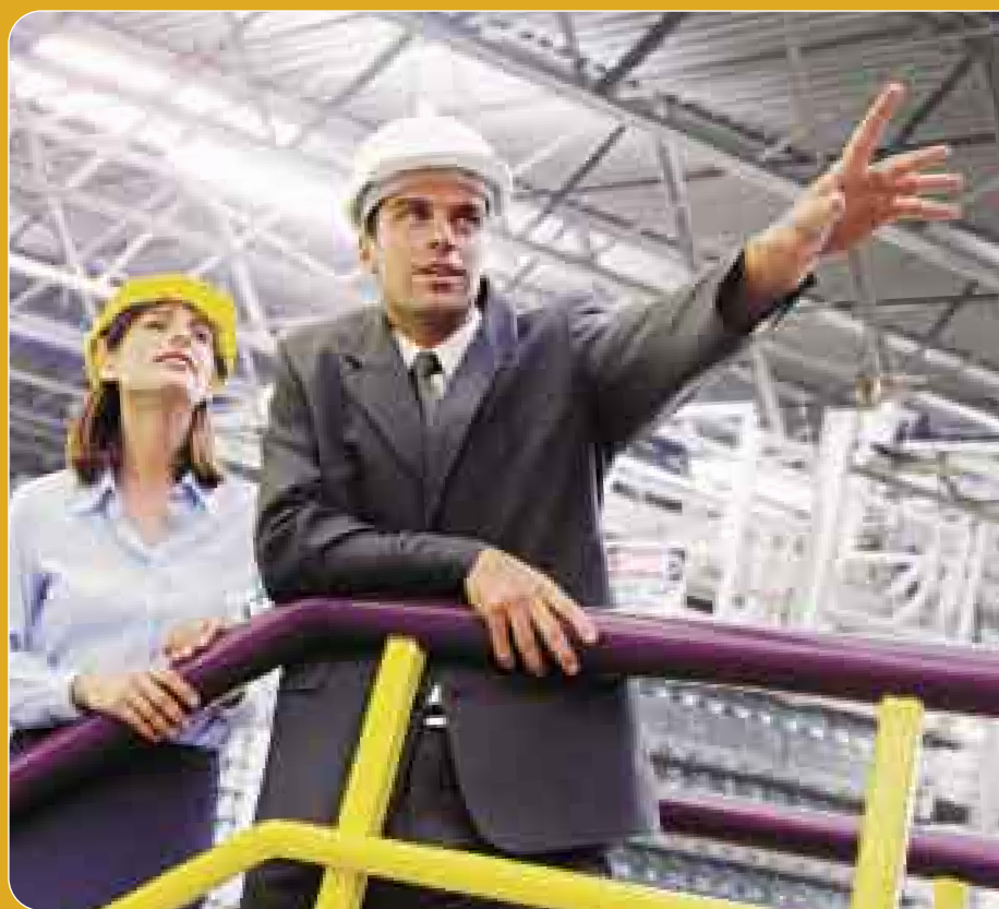
ILUSTRACIÓN: ALONSO NUÑEZ

ALLAN WAGNER AGENTE DEL ESTADO PERUANO 5 DE ENERO DEL 2008