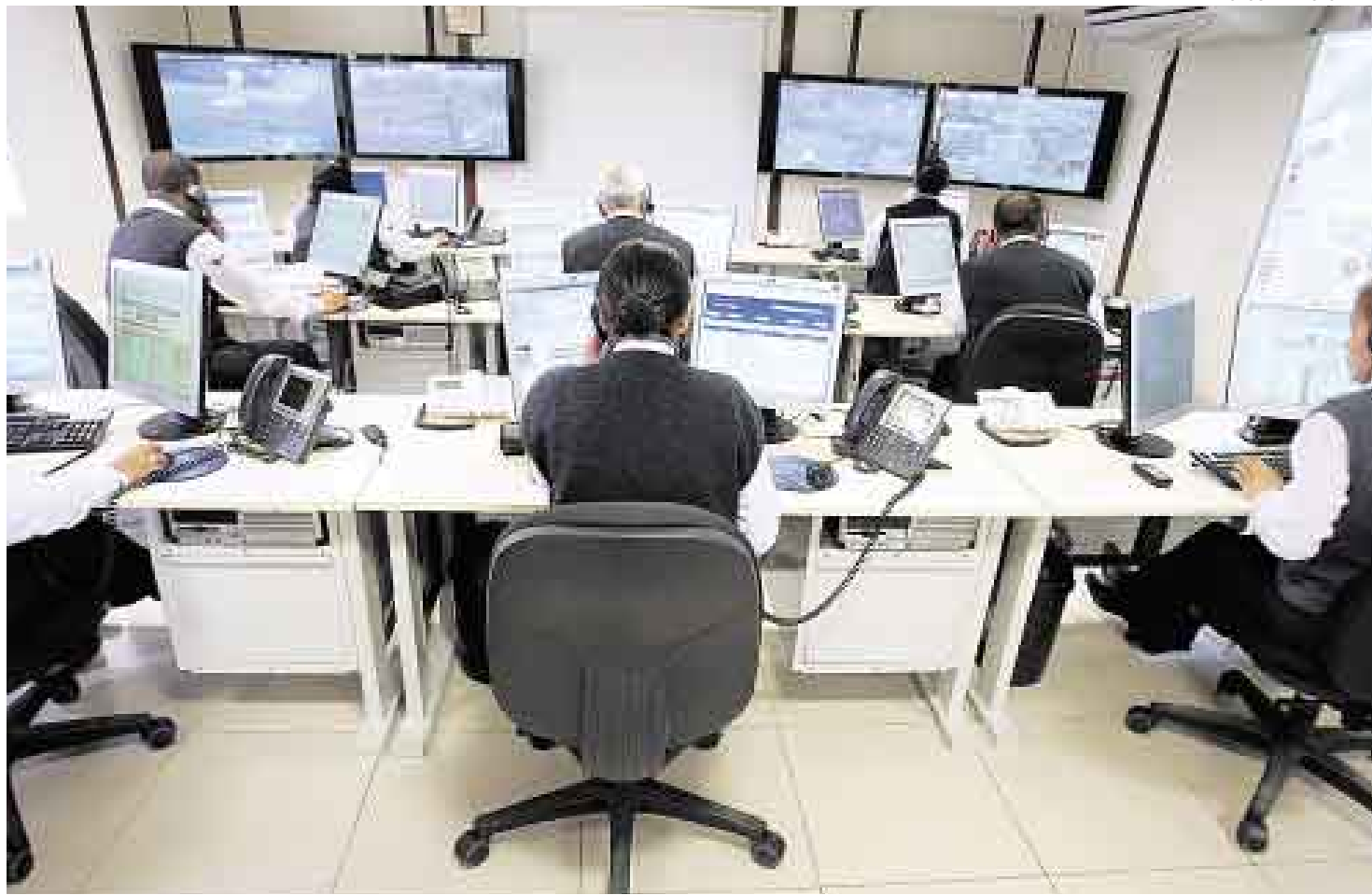
RESGUARDO. El Concejo de Surco ha efectuado mejoras técnicas en su central de emergencias, pero no llegó a adquirir las cámaras que prometió.