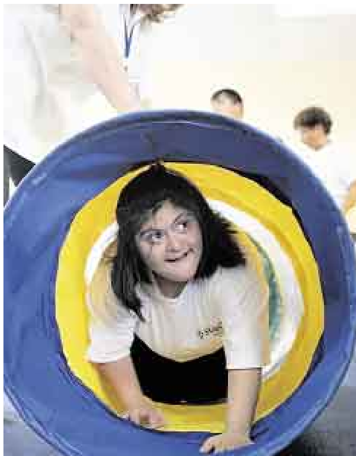
LOCAL. Del Mar construyó un centro para personas con discapacidad.