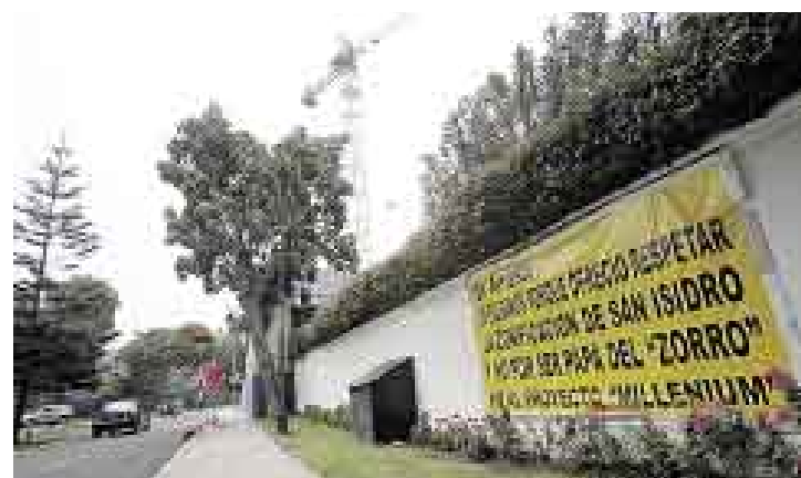
ALTO. Este proyecto inmobiliario suscitó una polémica en San Isidro.