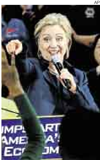
NADA FÁCIL. La senadora fue sorprendida por la derrota en Iowa.

La especialista en temas de reforma del Estado sostiene que, aunque estén equivocados, los fallos del Tribunal Constitucional deben ser acatados bajo el principio de resguardar la seguridad jurídica. Aquí su mirada sobre la semana