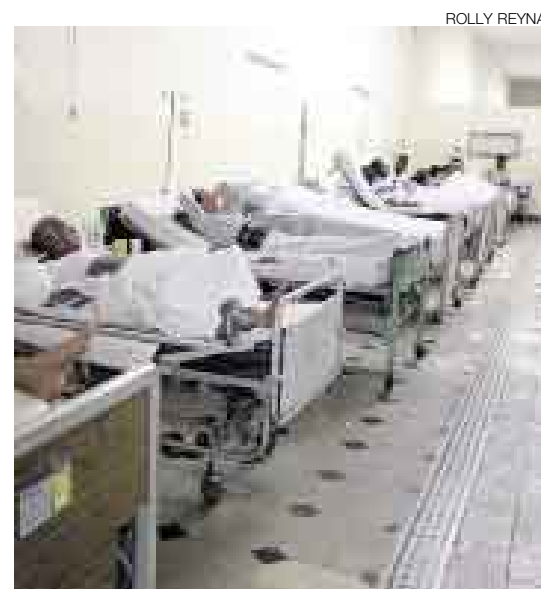
DE MAL EN PEOR. Los pacientes son los principales perjudicados con la paralización de los galenos.