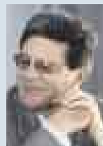
RAFAEL REY , MINISTRO DE LA PRODUCCIÓN.

● Esta semana el Produce dio un paso adelante con la aplicación del programa Pesca Limpia, con el cual se establece mecanismos para proteger el medio ambiente marino y sanciones para los contaminadores.