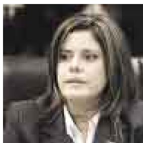
A LA CAZA . BUSCA NUEVO DIRECTOR PARA EL CNC.