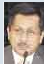
FERNANDO BARRIOS , PDTE. DE ESSALUD.

● El Estado puede obtener condiciones muy favorables en las licitaciones y adjudicaciones, como la reciente entrega de la banda de 460 MHz, por la cual aumentará en 30% la penetración de telefonía fija en Lima.