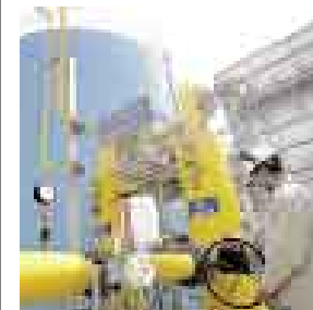
OTRO CICLO . IMPULSAN USO ELÉCTRICO DEL GAS NATURAL.

El Ministerio de Energía y Minas estaría alistando un proyecto de ley por el cual se incentivaría la construcción de plantas de ciclo combinado, con la utilización de gas natural. Dicho proceso implica un mejor aprovechamiento del combustible y permitiría que las generadoras, ubicadas en Chilca , aceleren sus inversiones e instalen nuevas unidades de generación, sobre todo ahora que existe una evidente falta de energía. Si no, que lo digan los que sufrieron los apagones durante la semana pasada.