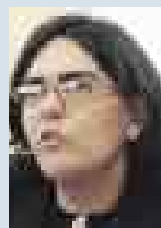
VERÓNICA ZAVALA , MINISTRA DE TRANSPORTES.

● Esta semana el Produce dio un paso adelante con la aplicación del programa Pesca Limpia, con el cual se establece mecanismos para proteger el medio ambiente marino y sanciones para los contaminadores.