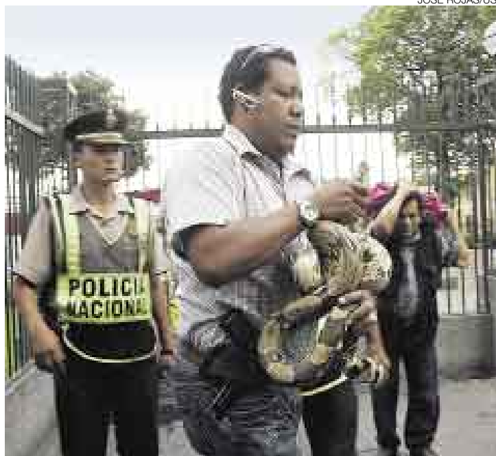
SANGRE FRÍA. Un oficial de la Policía Ecológica atrapa a la boa y la lleva al patrullero. Ahora se encuentra en el local del Inreña, en Jesús María.

Personal de la comisaría de Cotabambas se acercó al lugar y decidió comunicar el hecho a la Policía Ecológica. Mientras esperaban la llegada de estos efectivos, los curiosos y los vendedores de una feria artesanal instalada en el Parque Universitario se