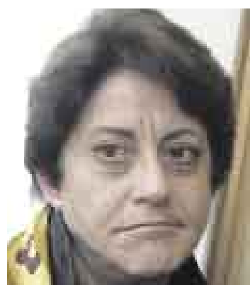
ALCORTA. Pide mejorar programas de cultivos alternativos.