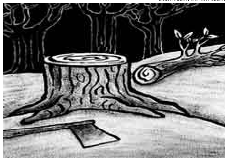
ILUSTRACIÓN VÍCTOR AGUILAR

Con estas líneas de gestión concuerdan organizaciones de la sociedad civil, algunos órganos estatales existentes, así como organismos internacionales. La discusión está ahora centrada en cómo debe ser la estructura y cuáles deben ser las funciones de este