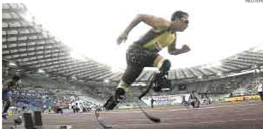
MUY CERCA. Pistorius estaba a menos de un segundo de una eventual clasificación.

El sudafricano Oscar Pistorius apelará ante la Federación Internacional de Atletismo que le negó la posibilidad de participar con sus piernas 'biónicas' en las clasificatorias para Beijing 2008. [A16]