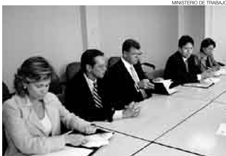
TRIPARTITO. Se busca mejorar clima laboral de los negocios portuarios.

Este grupo de trabajo recibió el encargo de elaborar en 60 días propuestas consensuadas que solucionen los problemas laborales del sector. Según se informó, fue convocado para prevenir futuras huelgas de estibadores, como la acontecida en noviembre del año pasado que generó cuantiosas pérdidas económicas en plena campaña navideña.