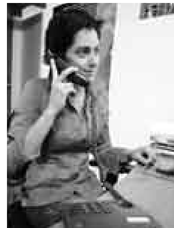
SIN SERVICIO. Empresas afirman que no podían hacer nada.