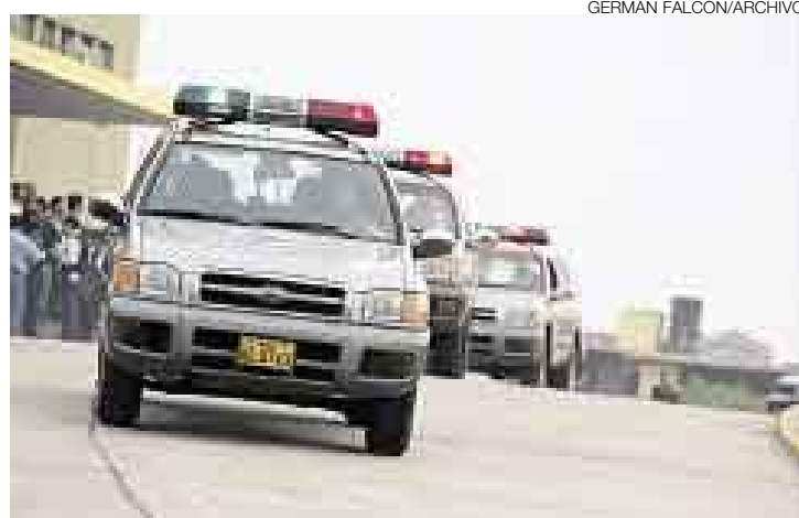
¿AHORA SÍ? Es hora de que la Policía Nacional cuente con una nueva flota.