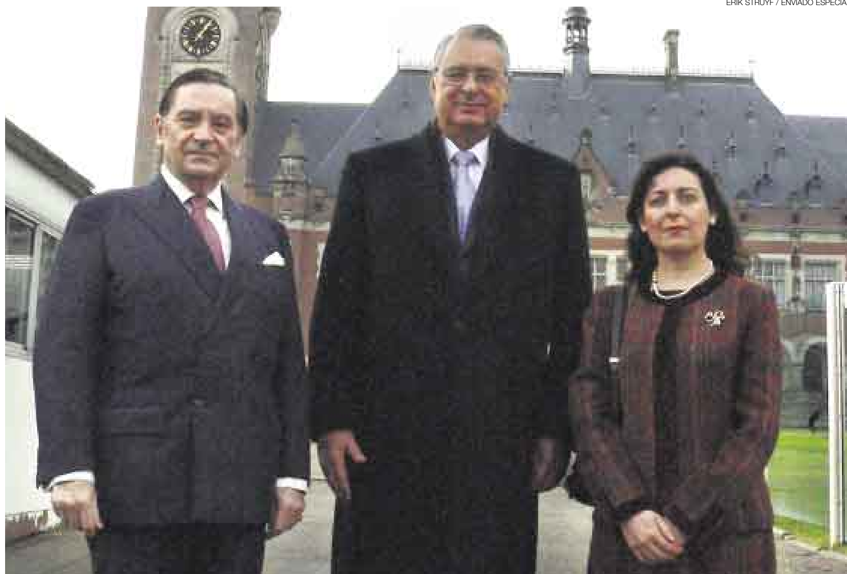
ERIK STRUYF / ENVIADO ESPECIAL

■ El Gobierno de Chile lamentó profundamente petición peruana