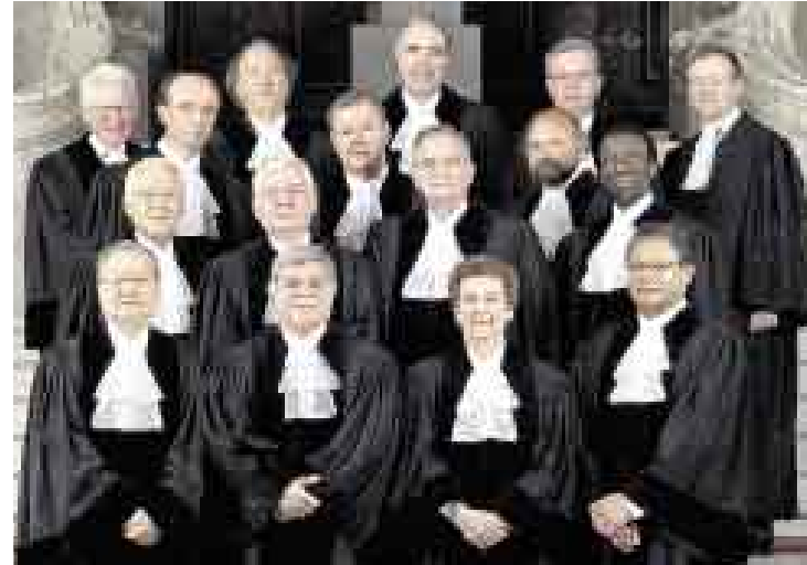
EN SUS MANOS. A través de un comunicado, la Corte de La Haya confirmó el inicio del proceso para solucionar controversia marítima con Chile.