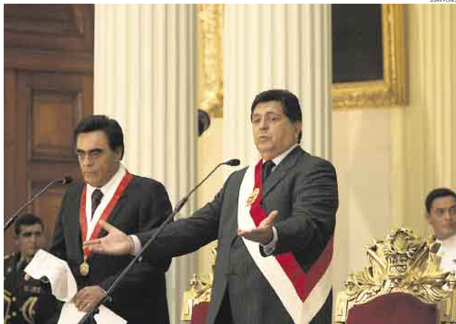
AL UNÍSONO. Alan García se presentó ante el Congreso para anunciar oficialmente la presentación de la demanda ante La Haya.

Luego de su paso por el Congreso, en declaraciones a la prensa, el mandatario comentó la reacción del canciller chileno, Alejandro Foxley, quien lamentó profundamente la demanda presentada por el Perú. “No es un acto inamistoso de ninguna manera solucionar un tema por la vía jurídica. Nosotros no hacemos amenazas, ni mostramos armas. Estamos absolutamente lejos de eso. (...) debemos persistir en tener una buena relación cultural, política y económica con Chile, que es un país finalmente hermano de origen. (...) Nosotros también lamentamos dar un paso jurídico. Siempre demandar jurídicamente a un hermano es una complicación, es lamentable. Pero lamentable es también que no hayamos llegado mediante un acuerdo diplomático equitativo y un diálogo político a una solución previa. Yo estoy seguro de que podríamos haber llegado a una equidistancia