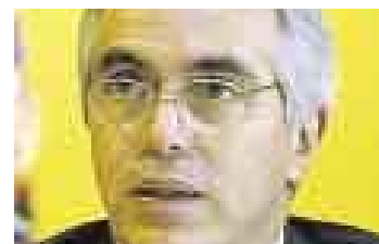
DIEGO GARCÍA SAYÁN EX CANCELLER DE LA REPÚBLICA

“Estos procesos judiciales son asuntos nacionales que no concierne a un Gobierno o canciller. Requieren –ante todo– continuidad. La jurisprudencia de la corte es determinante y el año pasado dijo que en el caso de Nicaragua y Colombia sí tenía competencia para resolver porque su tratado de 1928 no definía el límite marítimo”.