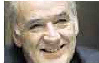
JOSÉ ANTONIO GARCÍA BELAUNDE CANCELLER PERUANO

“Hubo acuerdos de pesca, pero no límites”