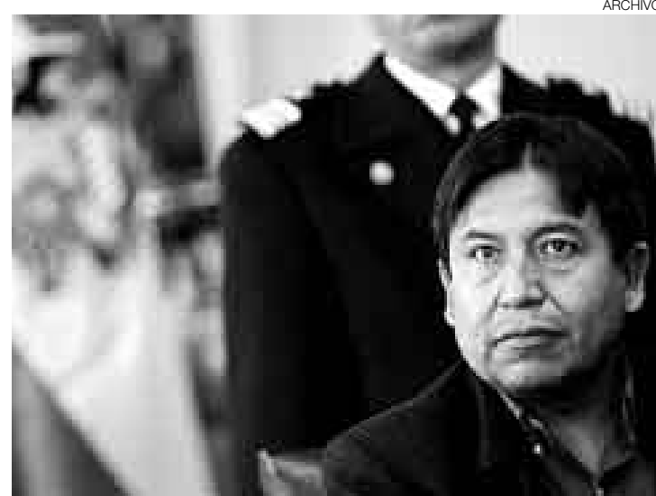
LO TIENE CLARO. Para el canciller boliviano, David Choquehuanca, el diferendo entre Perú y Chile es una cuestión bilateral.

El funcionario dejó entrever que el reclamo peruano podría postergar las negociaciones con el gobierno de Michelle Bachelet. ■