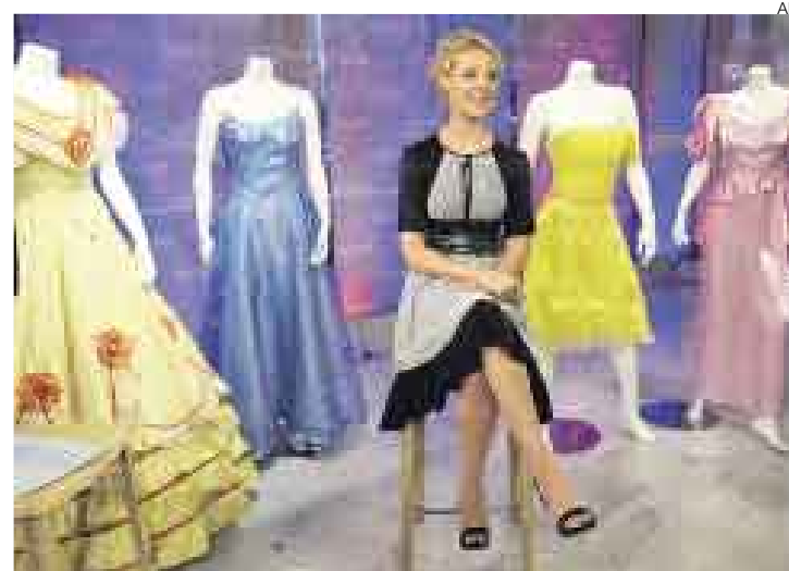
HEIGL. La bella actriz protagoniza la comedia romántica "27 Dresses".

recibió un Emmy. Luego, Barbara Walters la eligió para su lista de las personas más fascinantes del 2007. Y para redondear el año, el 25 de diciembre contrajo nupcias con el cantante Josh Kelley, a un mes de estrenar "27 Dresses". El filme acaba de llegar a la cartelera en Estados Unidos, aunque las críticas no han sido del todo favorables para Heigl.