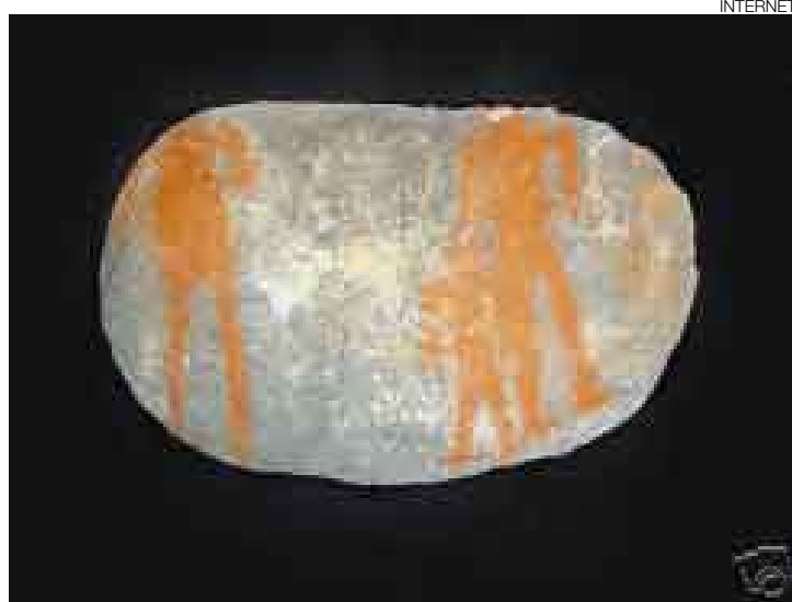
EN SUBASTA. Imagen de una de las cuatro supuestas piezas de arte rupestre de Tinyash puestas a la venta. La oferta fue reabierto hasta el domingo.