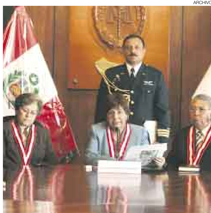
CONDUCTA EN LA MIRA. La fiscal de la Nación tendría que dar sus descargos y explicaciones si el CNM le abre proceso disciplinario.

La indagación a la titular del Ministerio Público será para ver