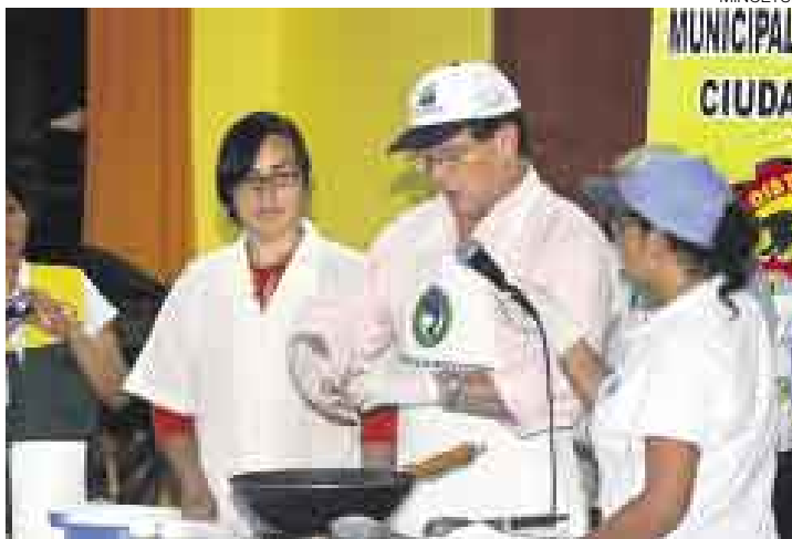
¿QUÉ COCINA RAFAEL? El ministro de la Producción, Rafael Rey, fomenta el consumo de anchoveta enseñando él mismo cómo prepararla.

ayer la disertación del secretario general del partido de gobierno Mauricio Mulder. ¿Un mensaje a la Nación? No, solo participaba en los coloquios apristas.