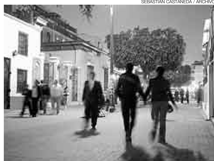
VIDA LOCA. En Barranco se establecieron límites al horario de las discotecas.