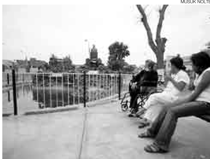
UNA OBRA. El Concejo de Barranco remodeló el parque de la Av. El Sol.