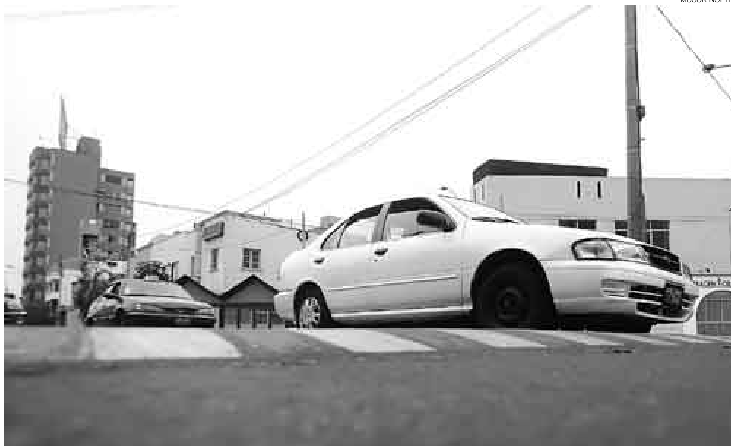
ROMPEMUELLES. La Municipalidad de Miraflores ha colocado más de un centenar de gibas con el propósito de reducir los accidentes de tránsito.

Mientras preparábamos este informe, llamó un vecino del sec-