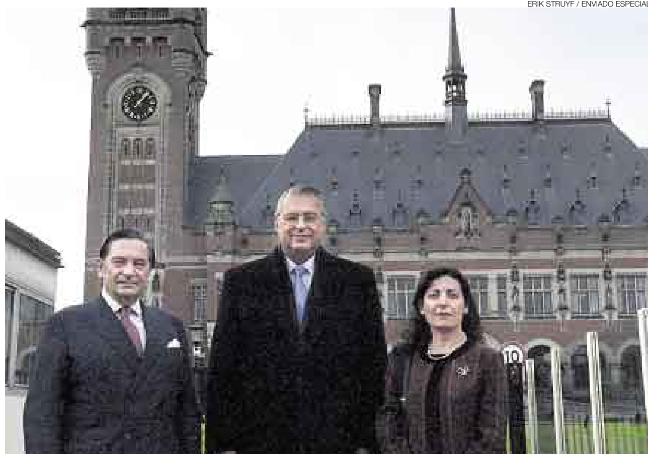
ERIK STRUYF / ENVIADO ESPECIAL