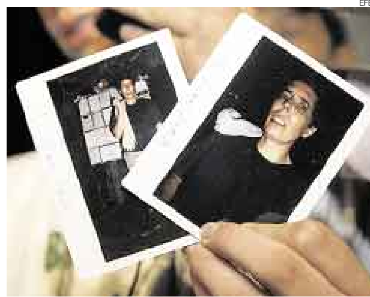
CRUELDAD. Un familiar muestra las imágenes de supervivencia del ex gobernador del Meta, Alan Jara, cautivo desde el 15 de julio del 2001.

No nos podemos llamar a engaño: Las Fuerzas Armadas Revolucionarias de Colombia (FARC), como cualquier grupo terrorista, no escatiman en crueldades a la hora de perseguir sus objetivos. Los testimonios de los secuestrados, recientemente salidos a la luz, revelan de manera escalofriante lo que uno de ellos explica con contundencia: "la maldad del malo y la indiferencia del bueno". Colombia tiene un gravísimo problema que resolver y más aun con Hugo Chávez azuzando a las FARC y erigiéndose en interlocutor de los asesinos. Si hay algo peor que las salvajadas sistemáticas de los terroristas es un gobernante irresponsable que agita las turbias aguas del populismo con sus constantes necesidades".