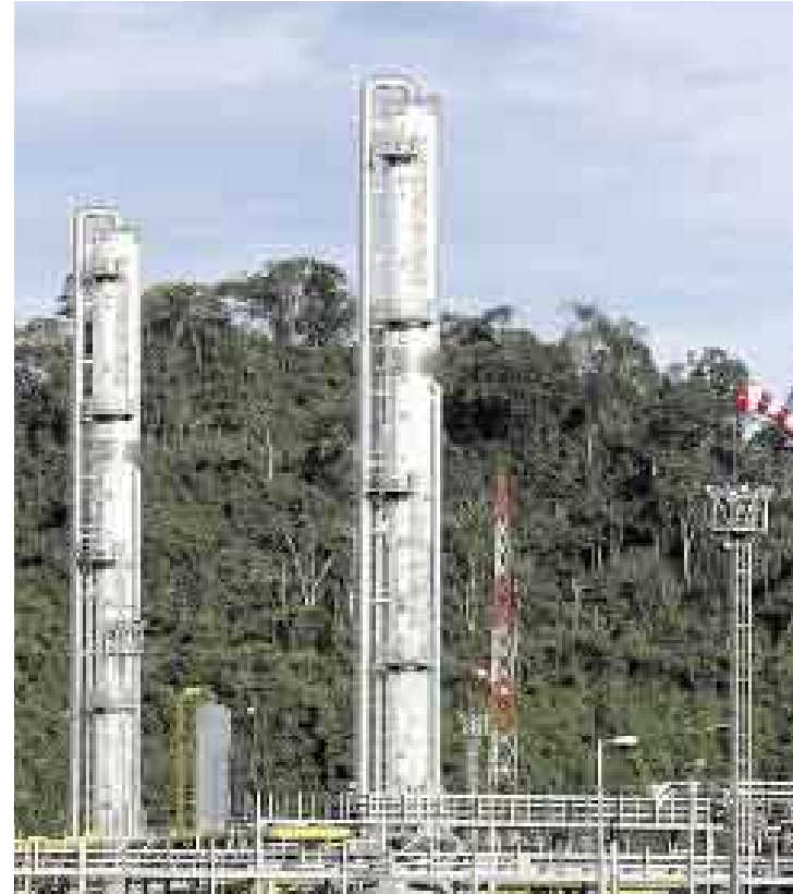
COMO CAMISEA. En Kinteroni hay reservas por 2 trillones de pies cúbicos.