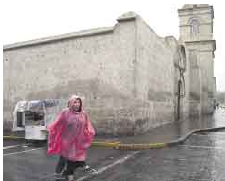
REGIÓN GOLPEADA. Arequipa ha sido la más afectada por las incesantes lluvias. Miles de personas han perdido sus casas y tierras de cultivo.

No teníamos suficiente con El Niño y de un tiempo a esta parte también tenemos a La Niña... De seguir así el cambio climático, tendremos que aguantar a la familia completa cuando menos lo esperamos y con más frecuencia de la que quisiéramos. De todas formas, es lógico (aunque sombrío) pensar que estos desajustes de la naturaleza por desgracia serán cada vez más frecuentes y solo queda esperar que el Gobierno Central y los gobiernos regionales y locales se encuentren preparados para paliar sus efectos, y que las tragedias que traen consigo se reduzcan a su mínima expresión: que no nos acostumbremos a ver todos los años imágenes de una población abandonada a su suerte.