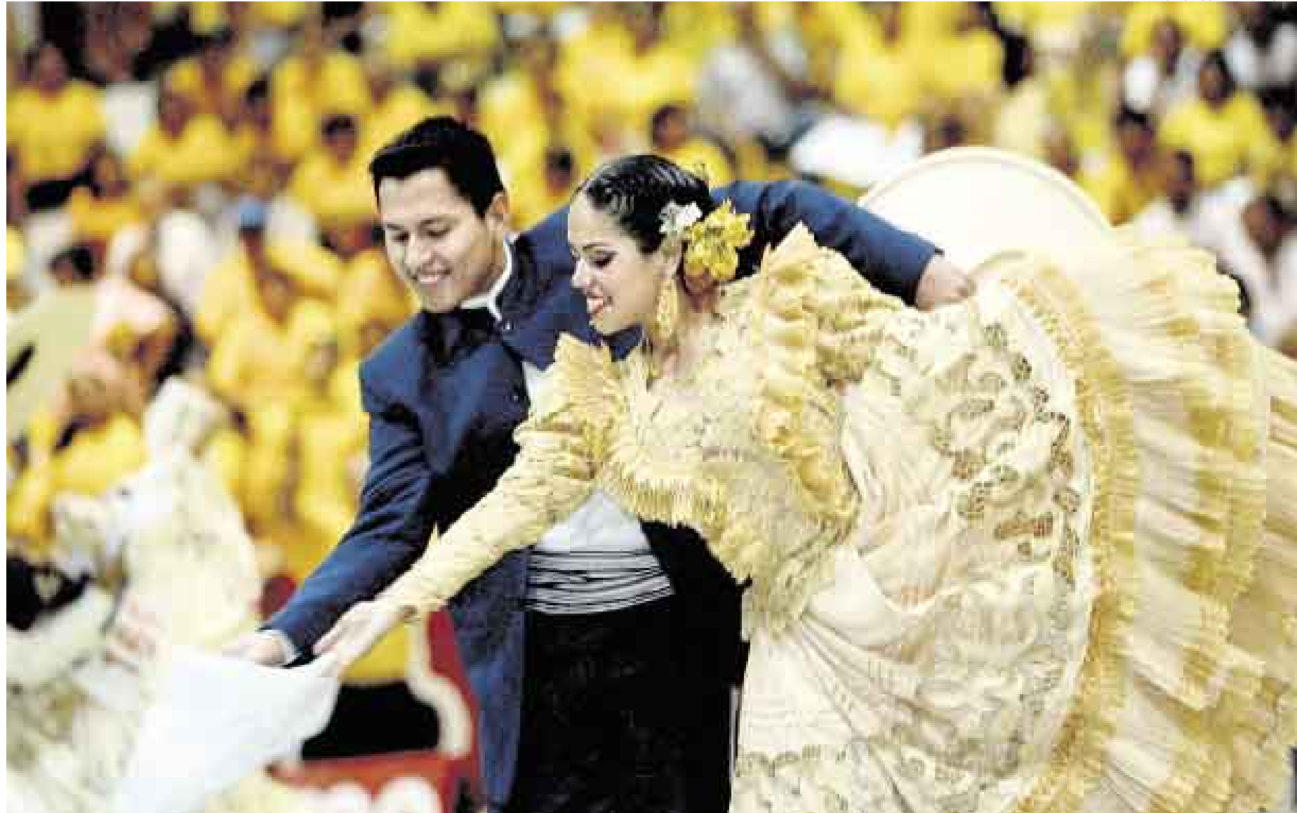
JOYA NACIONAL. La marinera es una de las expresiones culturales peruanas más preciadas. Pese a ello, una compatriota radicada en Chile decidió patentar nuestro baile tradicional.