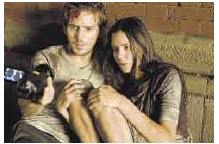
MILLONARIA. El filme recaudó US$41 millones en su primera semana.