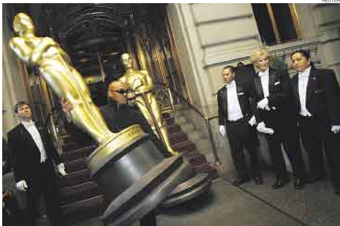
EN DUDA. La ceremonia podría tener el mismo destino que la entrega de los Globo de Oro.