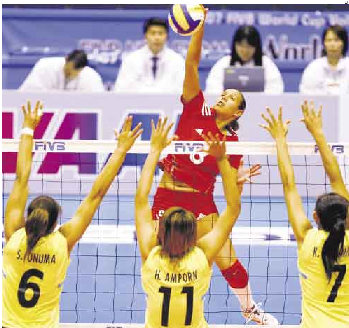
A saltar. El vóley fue el deporte peruano que más apoyo económico recibió durante el 2007. La federación fue ayudada con más de un millón de dólares.

Las tres fueron las más beneficiadas por el apoyo estatal, seguidas por karate (768.555 soles), fútbol (652.000 soles) y bádminton