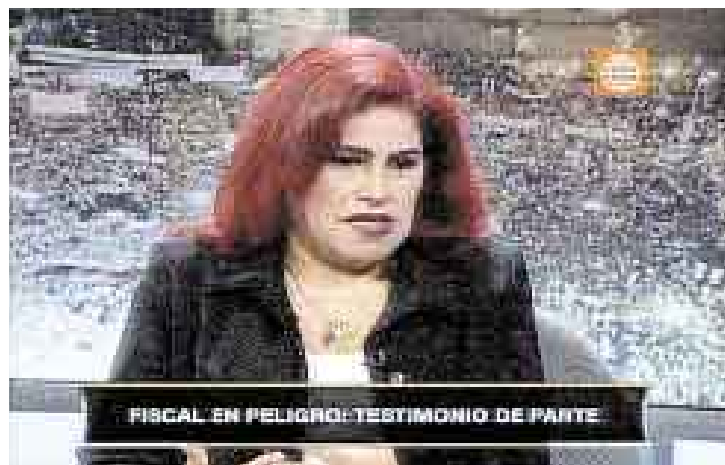
LOAYZA. La fiscal que se enfrentó a Zevallos pasa por duros momentos.

cales Supremos ampare mi derecho”, señaló anoche.