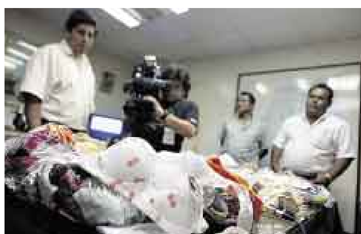
FRUSTRADO. La policía confirmó la presencia de droga en la ropa interior.

El hecho de haber pagado 800 dólares por enviar once kilos de ropa interior femenina de mala calidad a Holanda hizo sospechar a los empleados de la agencia TNT de La Victoria de que algo se ocultaba. En efecto, la policía confirmó que las prendas estaban impregnadas de tres kilos de cocaína líquida. Ya fue identificada la persona que dejó la encomienda, pero su nombre se mantiene en reserva.