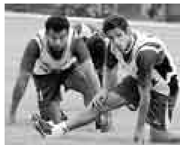
AMISTOSO. Ante Deportivo Quito.

● Trujillo. “Hay hermanos muchísimo que hacer”. César Vallejo se presenta hoy. Será a las ocho de la noche ante el Deportivo Quito de Ecuador en el estadio Mansiche. Este cotejo servirá para que el público trujillano conozca al equipo que lo representará en la Primera División.