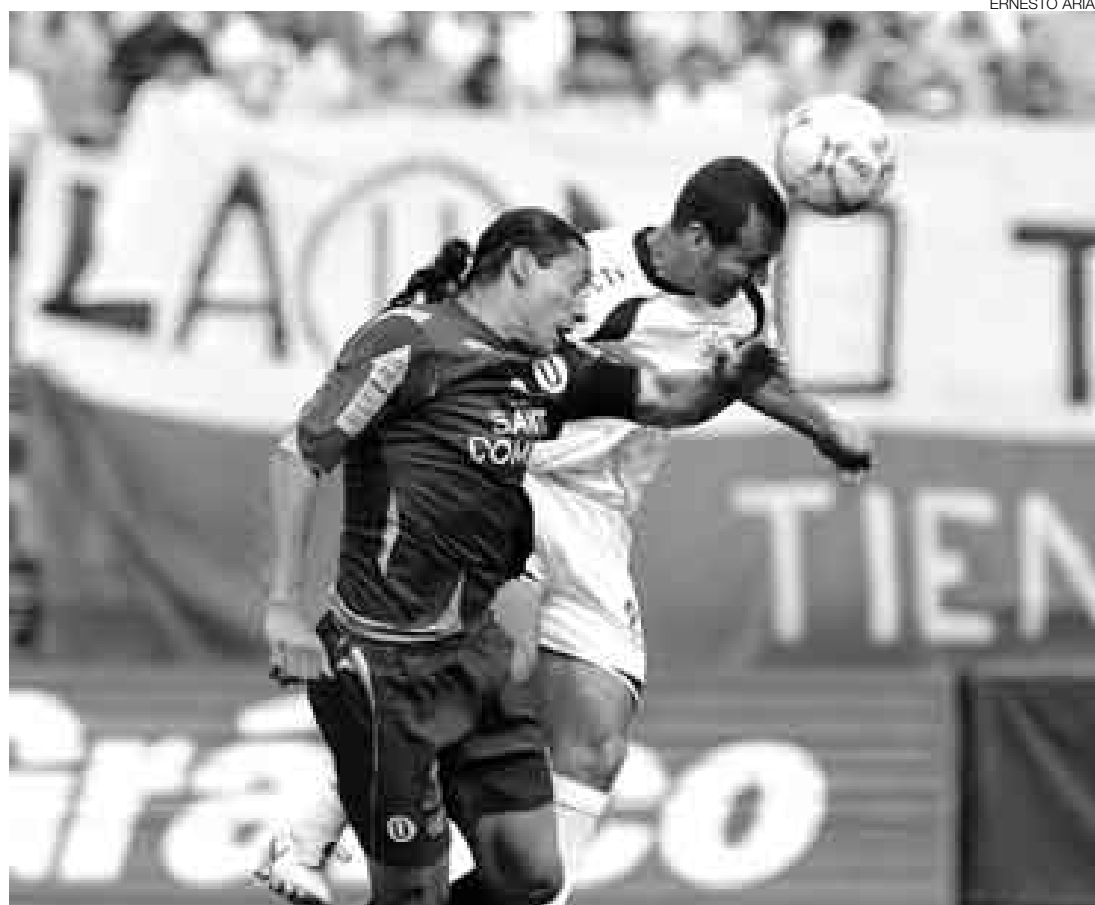
UNO POR OTRO. Solo podrán reemplazarse entre extranjeros, de modo que solo quedarán tres en cancha.

Aún falta que la propuesta sea reafirmada en la sesión que se realizará el miércoles de la próxima semana, y luego tendrá que ser aprobada por la PPF, situación que según algunos de los delegados podría mostrarse un poco complicada ya que la máxima entidad del fútbol peruano propuso todo lo contrario: Re-