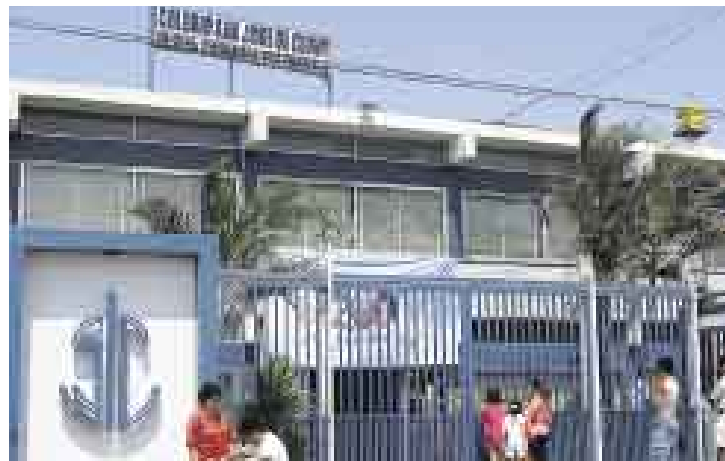
SAN JOSÉ DE CLUNY. En este colegio del distrito de Surquillo, los inspectores de Indecopi detectaron irregularidades en el proceso de matrícula.

En el colegio San José de Cluny, en Surquillo, Indecopi constató que la matrícula se condiciona al pago previo de 180 soles por con-