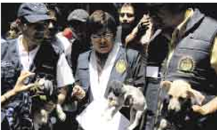
INFORMALES. Tres locales fueron intervenidos por vender perros sin pelo.

Por ser considerados patrimonio nacional, la policía, –junto con la fiscalía, el Concejo de Lima y el Ministerio de Salud– intervino tres locales donde se vendía informalmente ejemplares del perro peruano sin pelo. En la operación se rescataron seis ejemplares y se sancionó con 3.500 soles a los propietarios de los locales ubicados en la quinta cuadra del jirón Ayacucho.