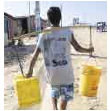
SIN AGUA. Sunass dice que metas de expansión no se cumplieron.

■ Empresa tiene hasta el miércoles para presentar sus descargos por no cumplir metas de gestión