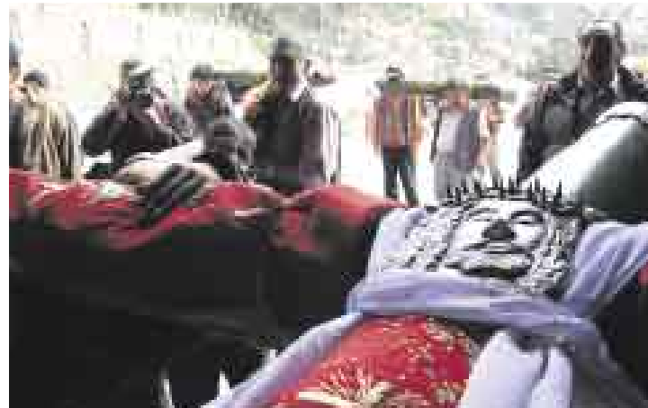
GALAS. Todos se afanan en presentar a sus cruces con sus mejores galas. Una sola cruz puede tener varias indumentarias.