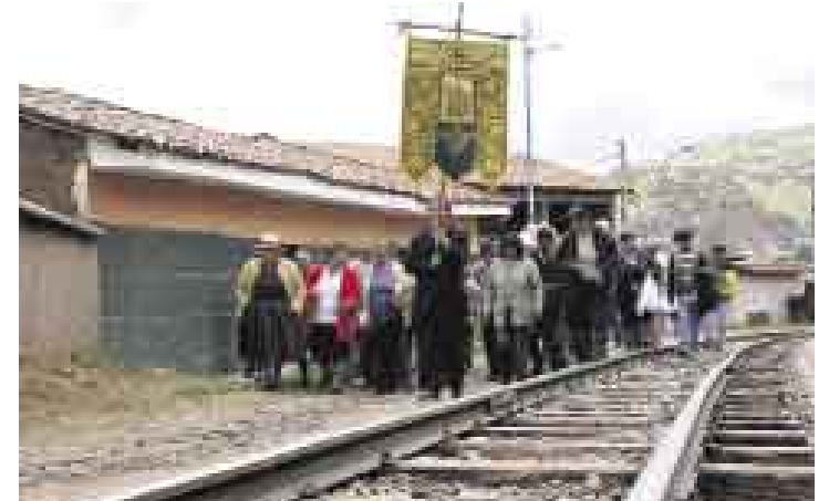
JUNTOS COMO HERMANOS. Tras el paseo de las cruces, los cusqueños celebrarán con chicharrón, chiriuchu y bebidas varias.