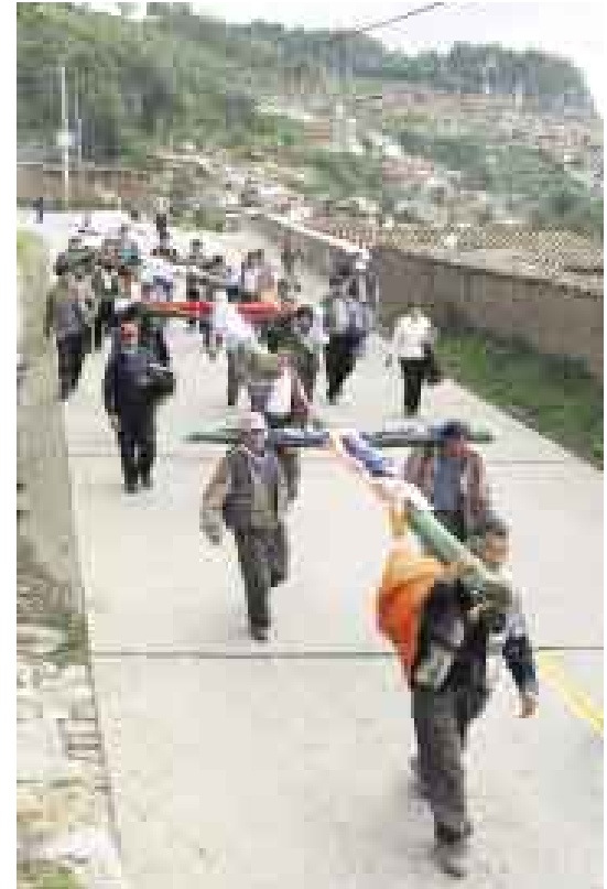
A LA IGLESIA. Todas las cruces y santos son llevados a la iglesia. Se escucha misa y se pide la bendición.