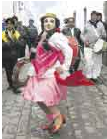
COQUETA. En realidad, se trata de un alegre varón que anima la fiesta.