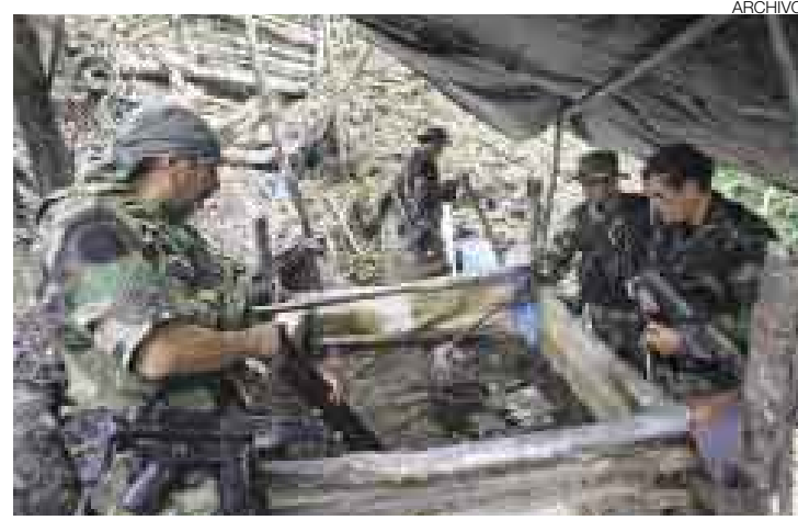
SE NECESITA. Dirandro y Dircote buscan reforzar su equipo en el 2008.

Ministerio del Interior que se mostraron seriamente preocupadas debido a que el incumplimiento ocurre luego de que la Dirección Antidrogas de la Policía (Dirandro) y la Dirección contra el Terrorismo (Dircote) solicitaran la asignación de personal a la Dirrehum y en momentos en que se debate reforzar la lucha contra el narcotráfico a raíz del asesinato de un sicario en las calles de la capital.