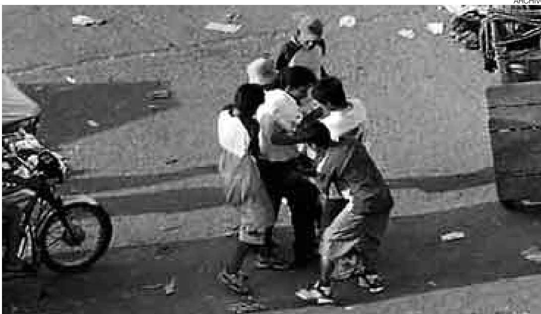
INSEGURIDAD. Especialistas inciden en señalar que la lucha contra la delincuencia no solo es un tema policial. El Conasec se creó para resolver estos problemas desde la sociedad.