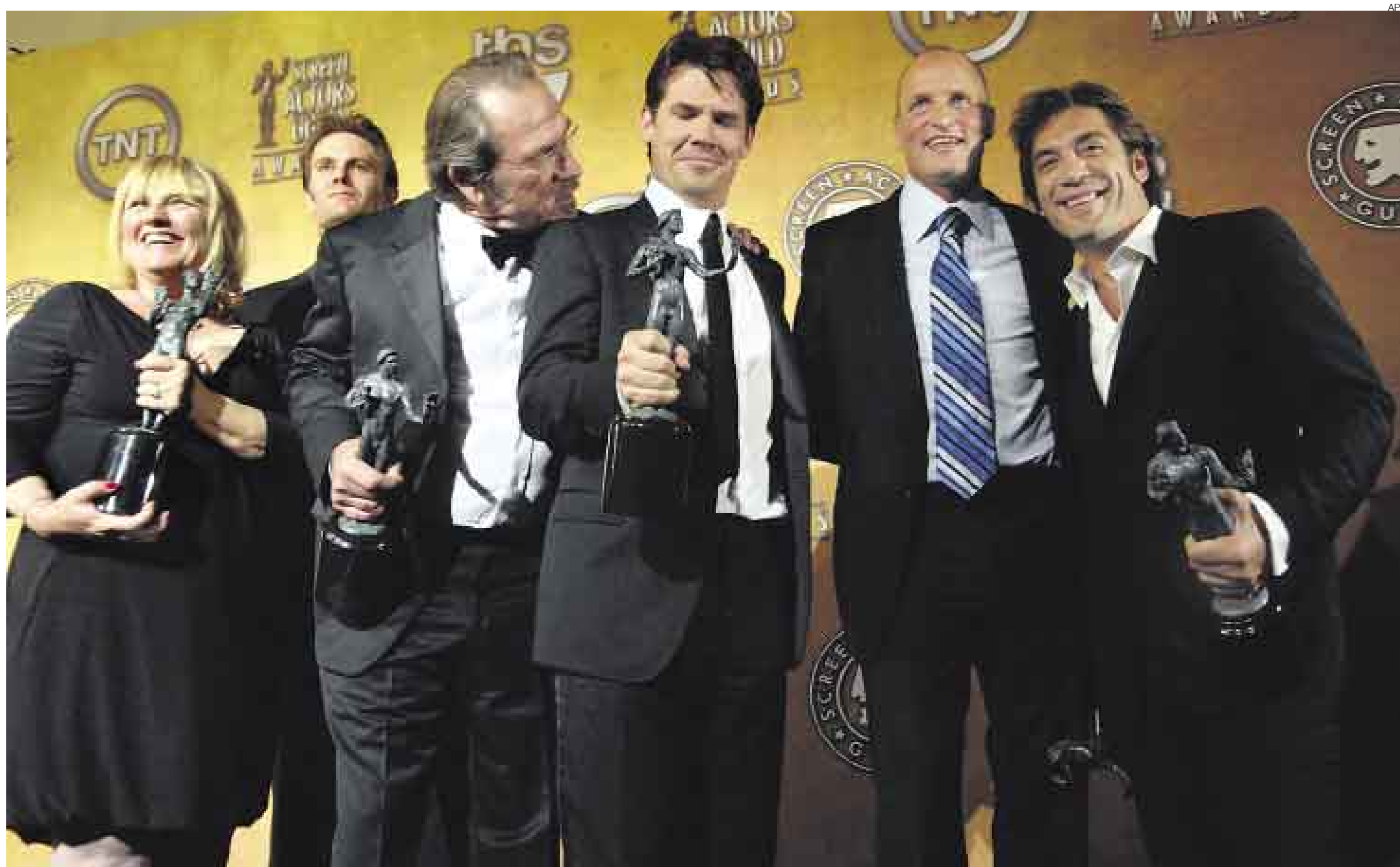
ELENCO. Tess Harper, Garret Dillahunt, Tommy Lee Jones, Josh Brolin, Woody Harrelson y Javier Bardem: el reparto de "Sin lugar para los débiles", la cinta de los hermanos Coen que ya se alza como gran favorita para los Óscar.

LOS ÁNGELES [REUTERS]. "No Country for Old Men" ("Sin lugar para los débiles"), la aproximación de Ethan y Joel Coen al western en pleno siglo XX, se quedó el domingo con el principal premio del Sindicato de Actores de Pantalla de Estados Unidos (SAG, por sus iniciales en inglés), lo que la posiciona como favorita absoluta para los Óscar.