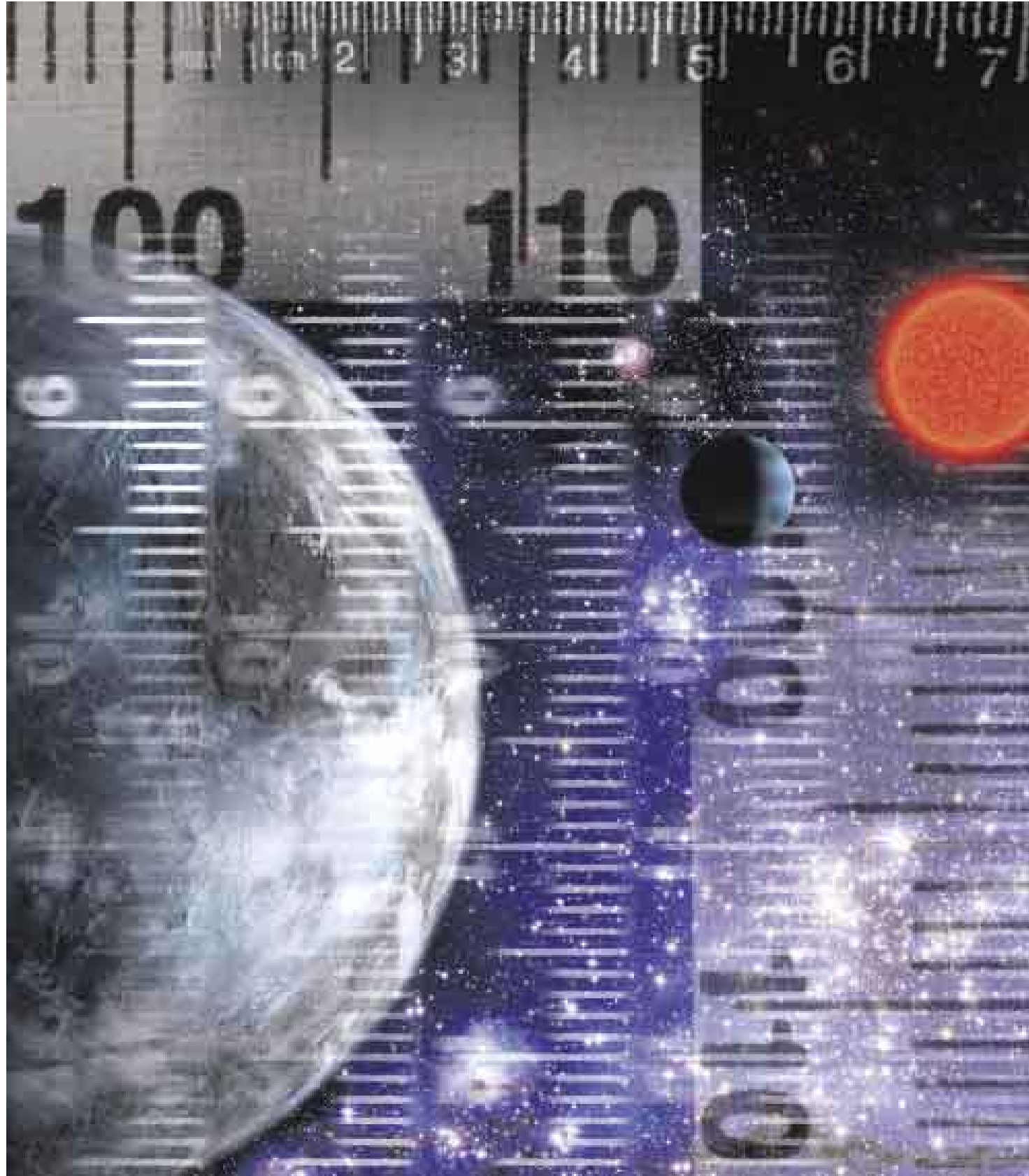
FOTOILUSTRACIÓN: VÍCTOR AGUILAR

En miles de kilómetros medimos las fronteras, las distancias entre países y continentes y el tamaño de los planetas interiores. El cruce más corto del Atlántico, de Natal en Brasil a Dakar en Senegal, tiene 3.050 km. Mercurio, el planeta más pequeño, tiene 4.880 km de diámetro, lo sigue Marte con