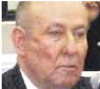
EL GENERAL. Hay expectativa por lo que dirá Hermoza Ríos.