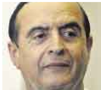
EL EX ASESOR. ¿Y qué responderá Montesinos Torres?