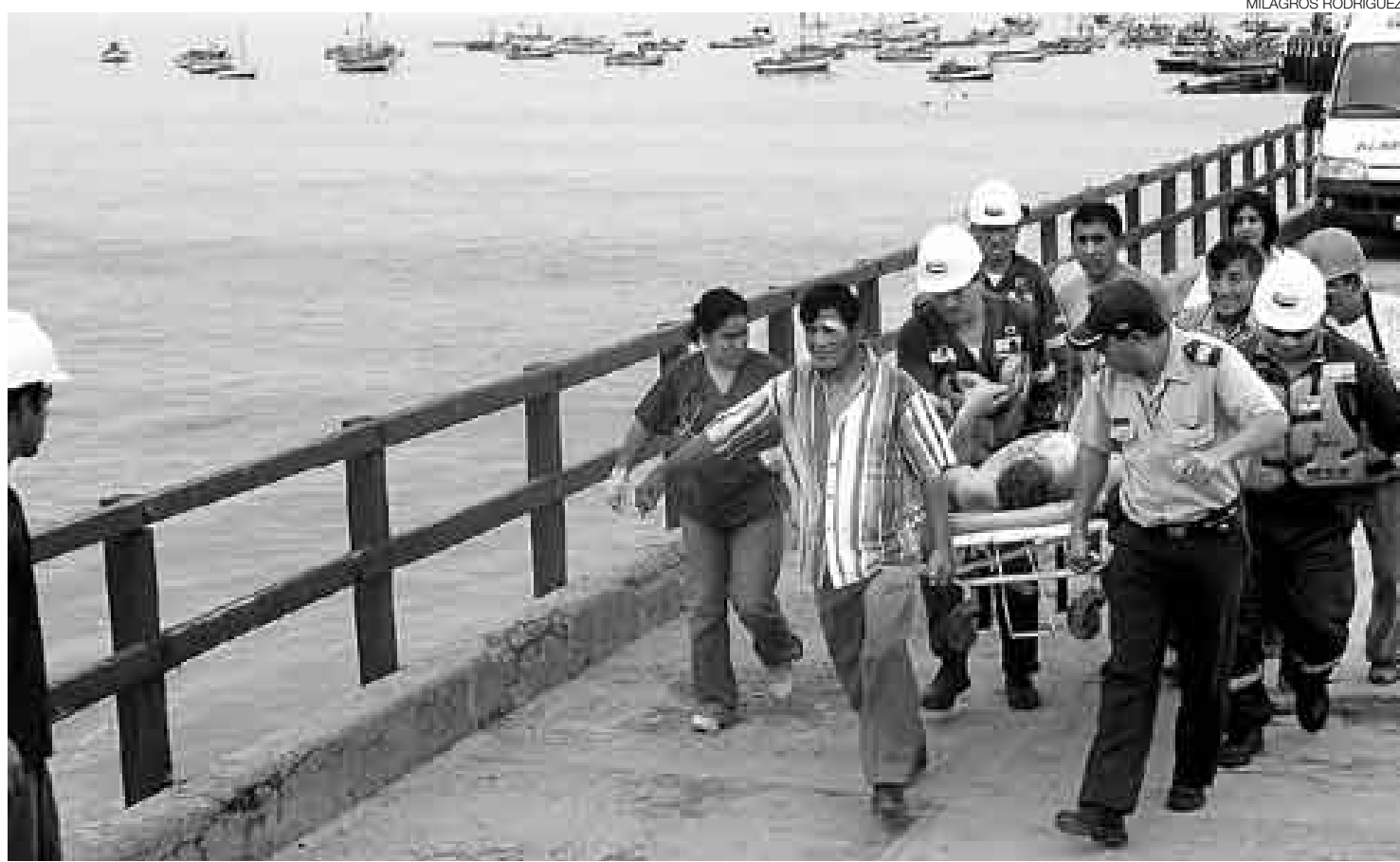
DRAMA. Momentos de tensión se vivieron luego de la explosión. Los heridos de mayor gravedad fueron trasladados a Lima.