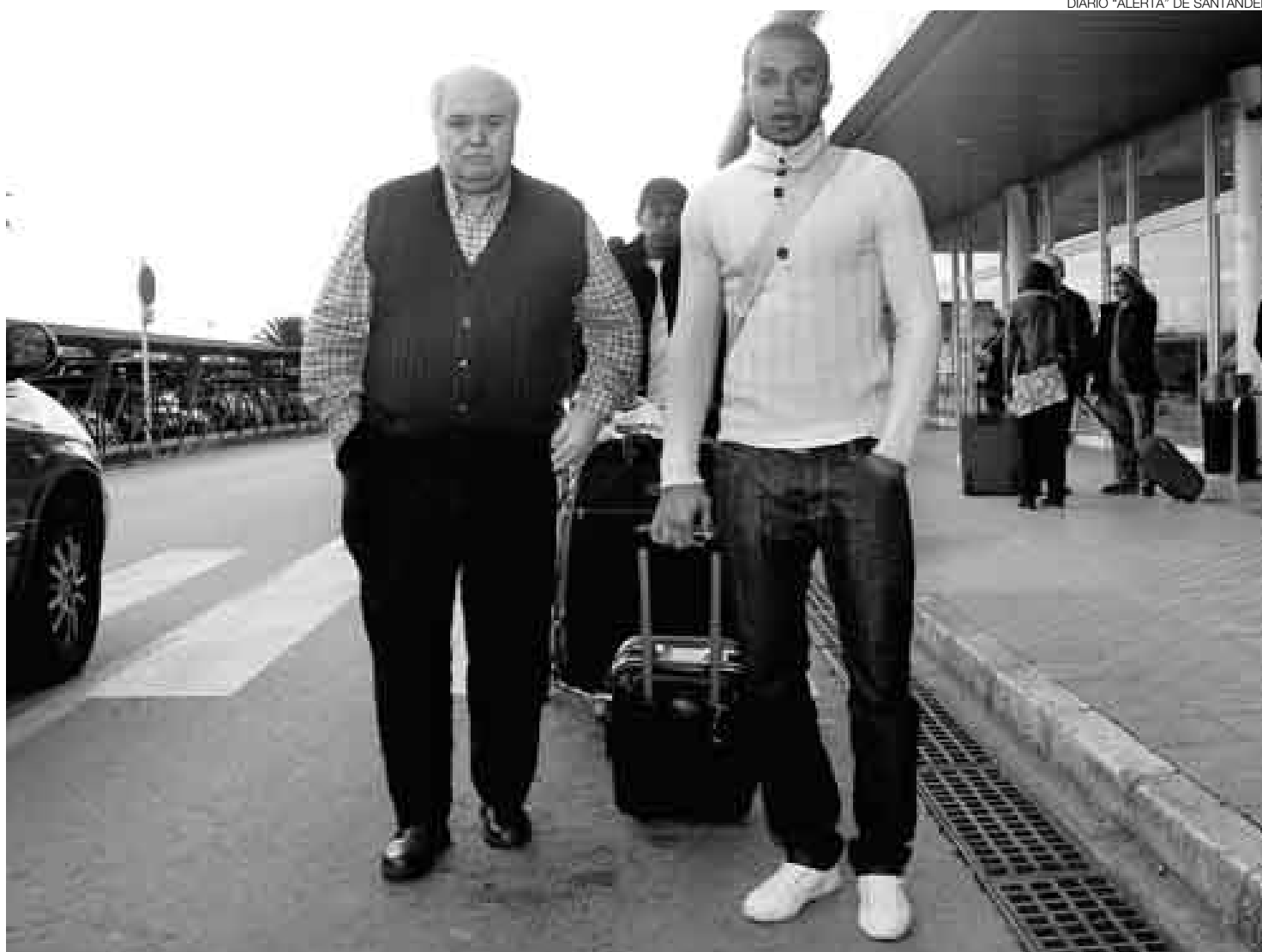
QUIERO MI FOTO. En pleno aeropuerto de la ciudad, este hincha del Racing de Santander posó con el joven jugador peruano.

Ísmodes aterrizó a las 5:20 de la tarde (hora local) en el aeropuerto de Santander acompañado por sus representantes: "Estoy contento y muy ilusionado por haber