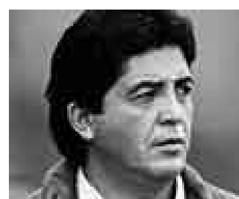
PRUEBA. Es la hora de Rivera.